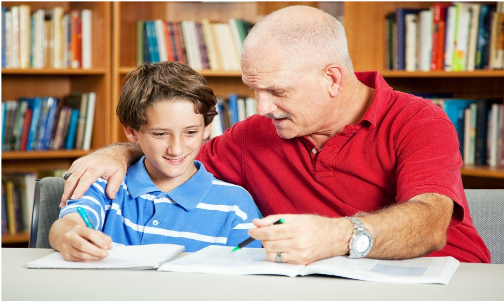
Grupo de crecimiento para padres