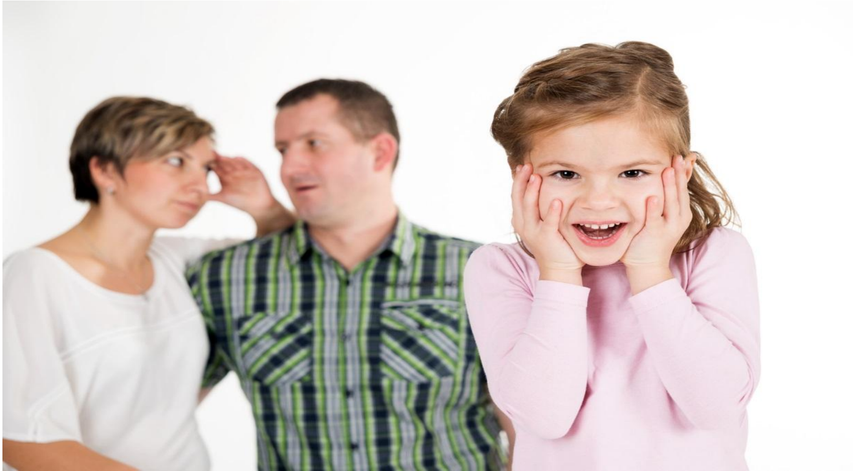
Grupo de crecimiento para padres