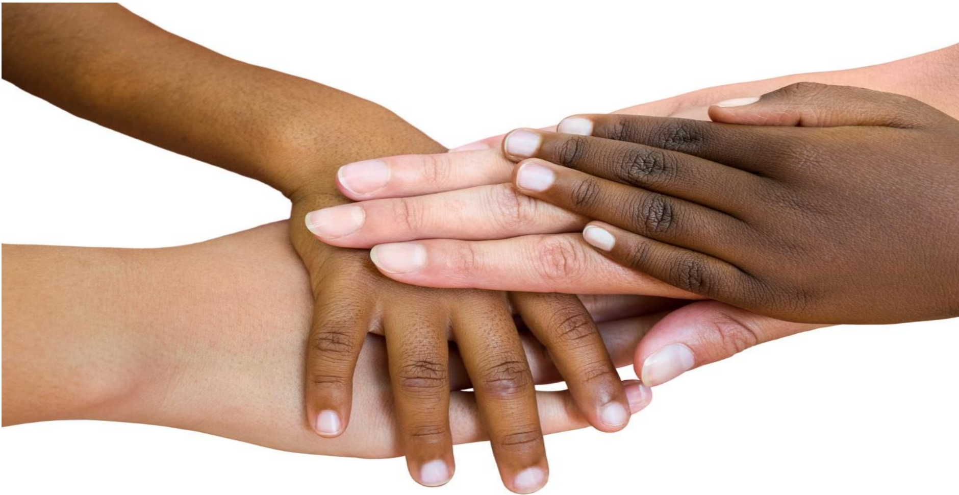
Grupo de crecimiento para padres