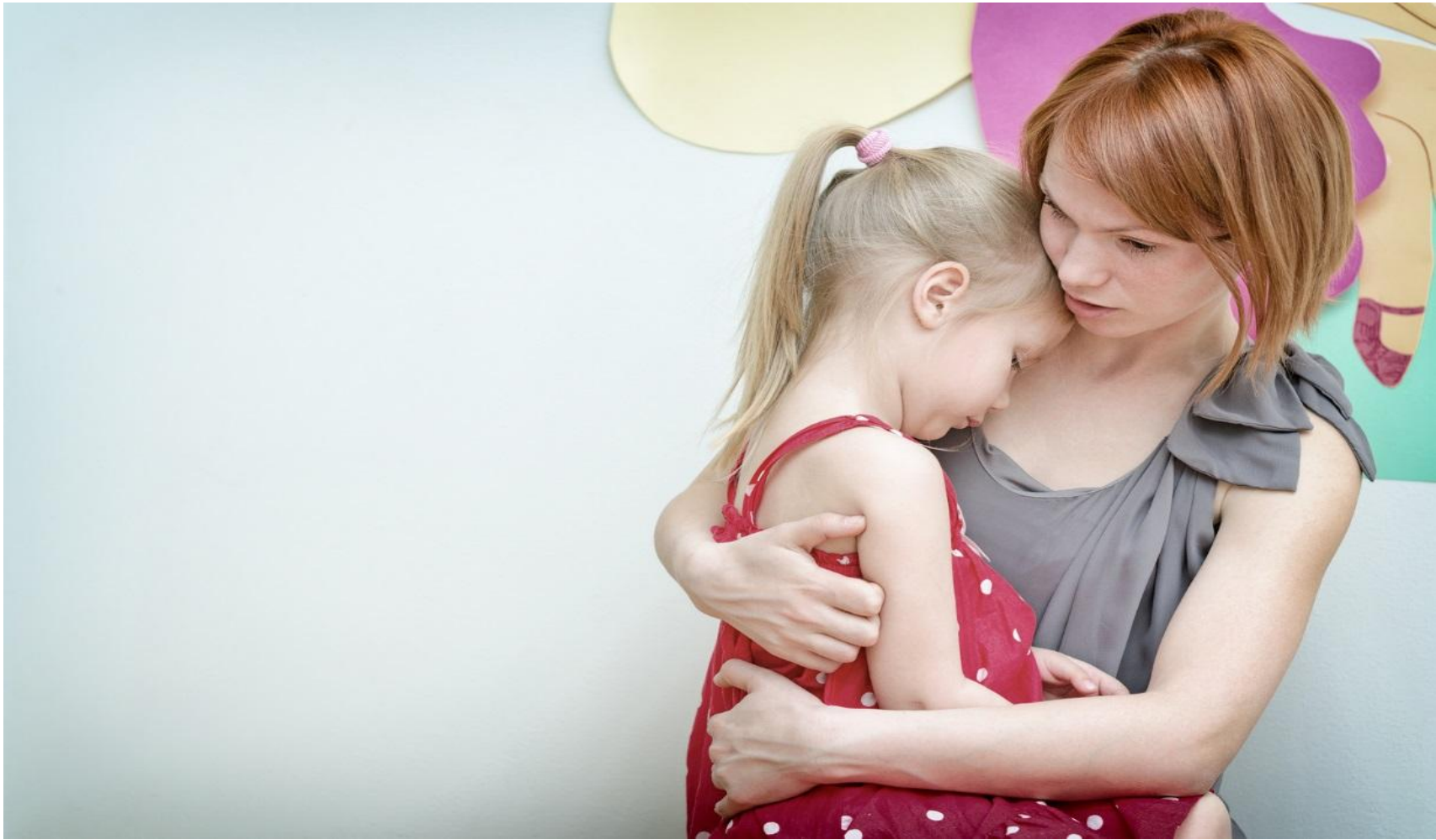
Grupo de crecimiento para padres